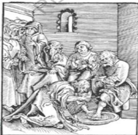
Passional Christi vnt