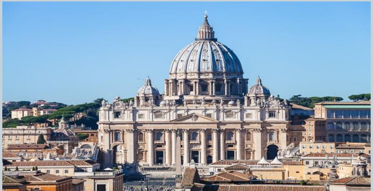
Codazzi, Viviano (aprox. 1630). Basilica de San Pedro, Roma . [Pintura].

Reforma: movimiento religioso iniciado en 1517, cuando el monje agustino Martín Lutero hizo públicas, en la ciudad alemana de Wittenberg, sus “95 tesis”. En ellas criticaba ciertas prácticas y aspectos de la doctrina de la Iglesia católica.