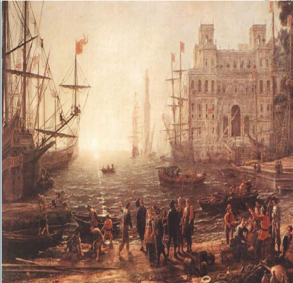
Lorena, Claudio de (1637). Puerto con la villa Médici . [Pintura].