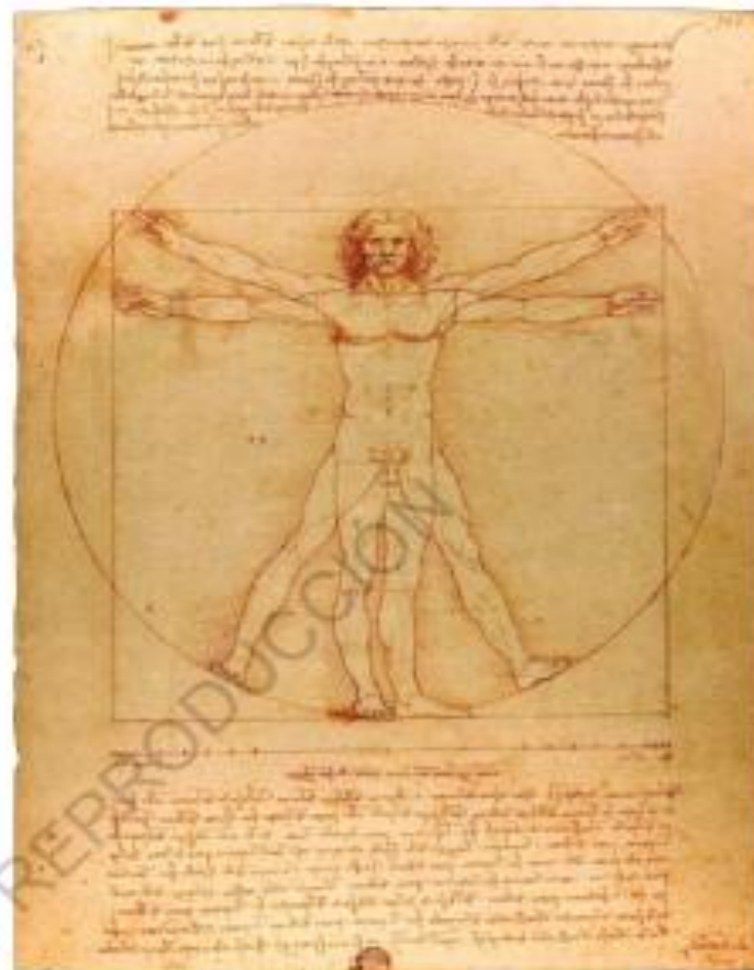
C Vinci, Leonardo da (1490). Hombre de Vitruvio. [Dibujo].

Humanismo: movimiento intelectual surgido en Florencia, entre los siglos XIV y XV, que revaloró la cultura de la Antigüedad grecorromana.