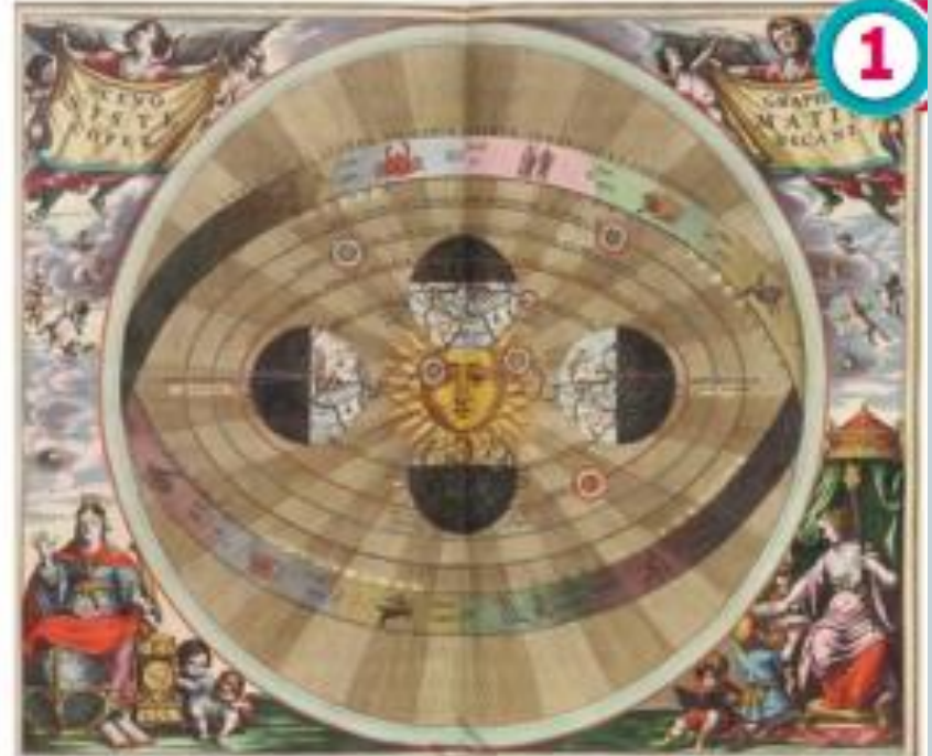
F Cellarius, Andreas (1661). Representación del sistema copernicano. [Grabado].