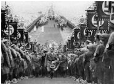
Hitler en Hurenberg

A partir de este momento, Hitler convierte el régimen democrático alemán en una dictadura: quedan prohibidos otros partidos, se limitan los derechos y libertades individuales y colectivas y se establece la censura. Se creó la Gestapo para controlar y eliminar a la oposición y gran parte de los intelectuales y científicos, entre ellos Einstein, debieron exiliarse.