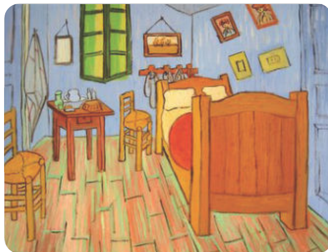
La habitación de Van Gogh en Arles, Vincent van Gogh, 1889, Musée d'Orsay.

Este cuadro representa el dormitorio de Vicente Van Gogh (pintor holandés, 1853-1890) que fue preparado para recibir a su amigo -también pintor- Gauguin. En él se aprecian dos puertas de color azul: una, a la derecha que se abría a la planta superior y la escalera y la otra a la izquierda que servía para comunicarse con la habitación de los invitados. En un lado de la puerta de la izquierda, se encuentra una silla de madera con asiento de paja y al otro una toalla. En la pared del frente una ventana y un espejo, debajo una mesa ligeramente descentrada, con diversos artículos sobre ella; junto a la cama una silla, detrás un perchero con ropa y sobre él un cuadro. La cama de amarillo (color utilizado continuamente por Van Gogh) con dos almohadas y cubrecama rojo; luego, en la pared cuatro cuadros. Todo sostenido sobre un piso de madera color rojizo con grietas verdes.