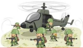
Contexto de Guerra

Toda obra literaria fue creada en una época específica, cada autor vivió hechos y circunstancias las cuales plasma de cierto modo en su obra literaria. Por ejemplo, un autor que haya vivido en una época de guerra probablemente sus obras sean sobre el conflicto vida-muerte o el exilio y la soledad . También influyen los gustos personales del autor, como sus temáticas favoritas o la música que escucha.